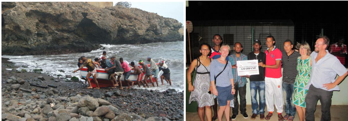
– Inköp av fiskeutrustning/starta ett kooperativ i fiskebyn Pregoíça. Samhällsföreningen Baía de São Jorge , São Nicolau