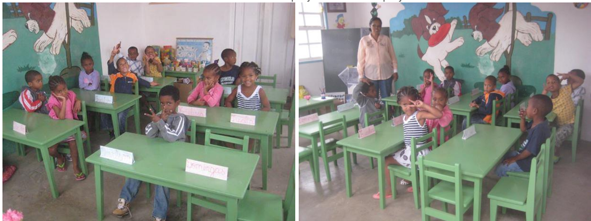
– Nya skolmöbler till 50 elever i förskolan Nho Taninho i Lém, tillverkade av lokala snickare. Brava kommun

Bilderna nedan är från de första två projekten som fick projektstöd 2013.