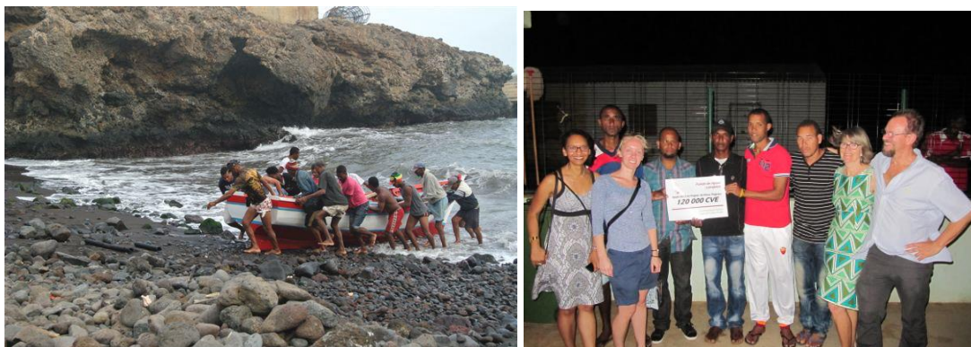
- Criação de uma cooperativa e compra de equipamento de pesca na vila piscatória de Preguiça, S.Nicolau. Pela Associação Baía de S. Jorge