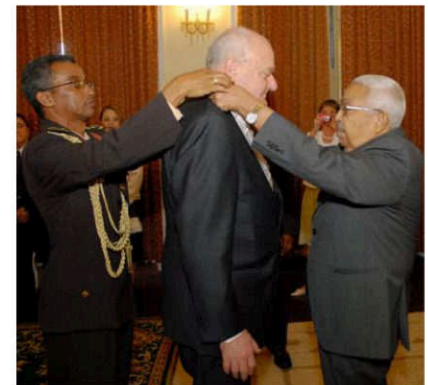
President Pires överlämnar Amílcar Cabral-orden