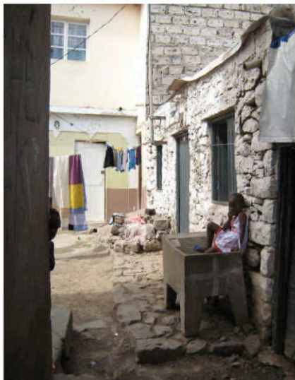
Miljöbild från omgivningarna till Black Panthers lokaler i Praia