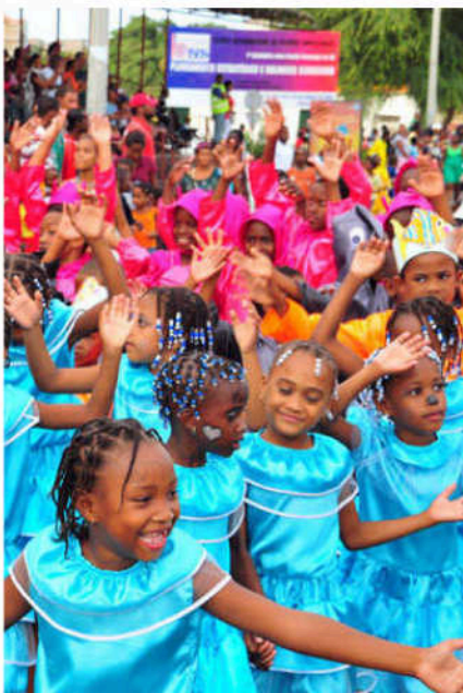
Barntåg i årets karneval