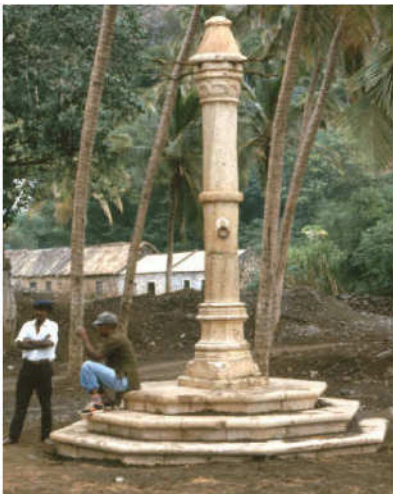
Slavpålen i Cidade Velha, ett av Kap Verdes historiska minnesmärken