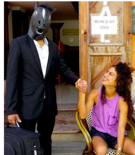
Humanos på gatorna i Mindelo