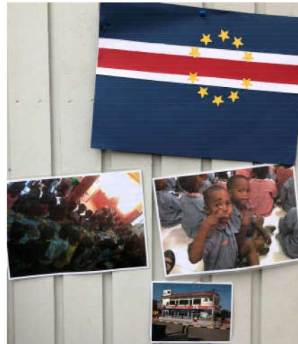
Kap Verdes flagga och bilder från Mini Black pryder skolans fasad.

Det råder stor kreativitet på förskolan. Barnen har kontakt med barnen på Mini Black via mail och brevfrösendelser. De får inblick i de fattigare barnens villkor och kunskap om det lilla öriket i Atlanten. Stjärnhimlens förskola är smyckad med barnens teckningar och andra alster, flaggor och kartor. Föräldrarna får handla saker som barnen gjort. Det är inramade teckningar, ljuslykter, husmodeller och annat. Man serverar korb med bröd