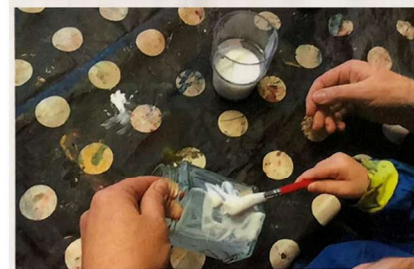
Tillsammans vi har målat lim på burken och satt fast löv. Vi pedagoger är medforskare och tillsammans med barnen upptäckter vi olika material.