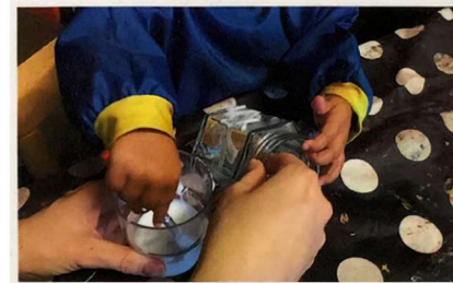
Bilder på några av barnens alster