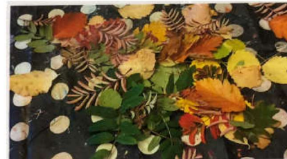
1-årsgruppen på Orion har gjort ljuslykter till Kap Verde basaren. Vi har plockat löv tillsammans och satt dem på glasburkar som blir till ljuslykter.

Några dagar efter vårt besök på förskolan blev barnen och personalen intervjuade av Radio Värmland i P4. Där sa barnen kloka saker som dom lärt sig i kontakten med barnen på daghemmet Mini Black på Kap Verde.