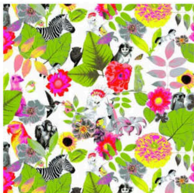
Tyg designat av Lena Melin. Det säljs via Hemtex.

Hemtex lanserade hösten 2013 tyget "Kap Verde" med exotiska djur som zebror, apor och lemurer, designat av Lena Melin på Textilhögskolan i Borås. En soffgrupp i grå rotting bär samma namn. Det finns även mindre föremål, t.ex. glasögonbågen "Cap Verde". Kanske har turismen bidragit till att produkterna fått dessa namn.