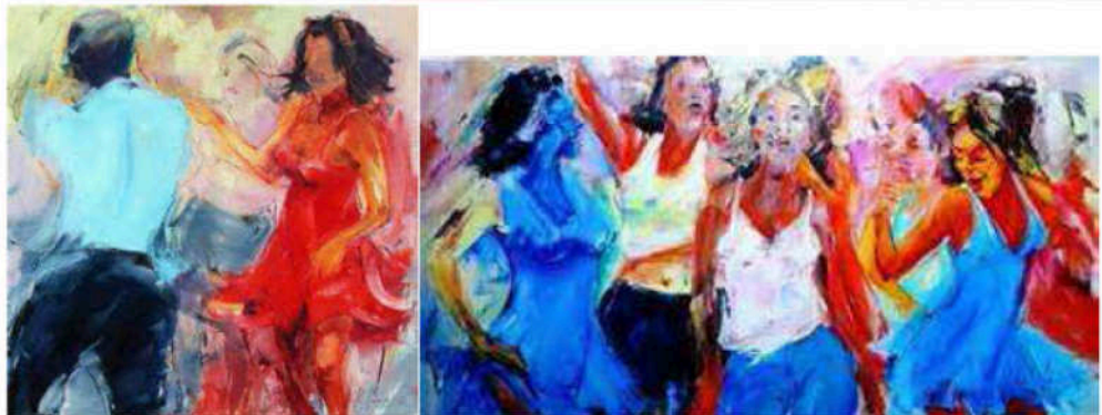
Målningar: Kiki Lima