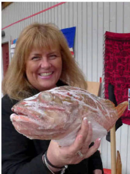
Garopa på Stjärnhimlens förskola