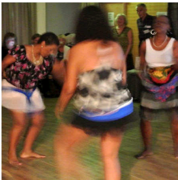
Dansuppvisningen satte fart på årets fest

Håll upp i rena burkar och förvara i kylskåp.