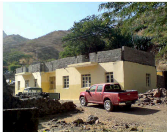
Centro Social i Godim

I byn Achada Fazenda strax före Pedra Badejo intill huvudvägen från Praia har bygget av en föreningslokal till idrotts-, kultur- och ungdomsföreningen ADENE pågått sedan flera år, till stor del med frivilligarbete. Abanso har finansierat byggnadsmaterialet och kommunen har bidragit med tomtmark, projekthandlingar och bygglov. Bygget har tidvis avstannat, men kommer nu under 2014 att avslutas med målning, golvmaterial, glasning etc. Här skall hållas möten, bedrivs ungdomsgård och ordnas idrottsaktiviteter, bland annat hand- och fotboll för tjejer och killar.