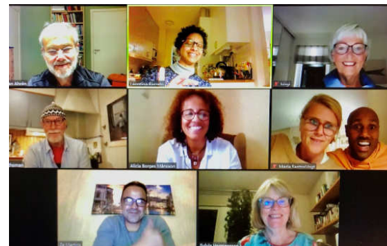
Skärmbild på nya styrelsen

Vi återupptar årsmöte med fest så fort som möjligt och varvar då platsen mellan Stockholm och Göteborg. Styrelsen kommer att arbeta med vår kommunikation och hur vi kan nå ut för att bättre marknadsföra föreningen. Vi ska också upprätta en verksamhetsplan och efter pandemin återuppta det tidigare initiativet att söka samarbete med charterbolagen för att få kontakt med deras resenärer.