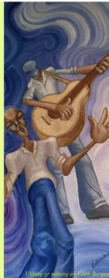
Utdrag ur målning av Edith Borges

Fadderverksamheten ger ekonomiskt stöd till föreningen Black Panthers i huvudstaden Praia. Deras daghem Mini Black tar emot 80 barn i en fattig förort. Tack vare våra faddrar har vi förändrat framtiden för många fattiga barn och deras familjer. Läs mer på www.caboverde.se/projekt