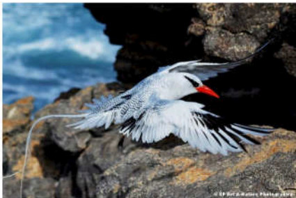
Vissa bilder är beskurna.