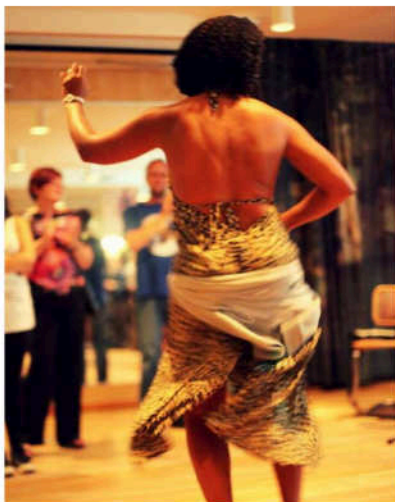
Årsfest i Puman