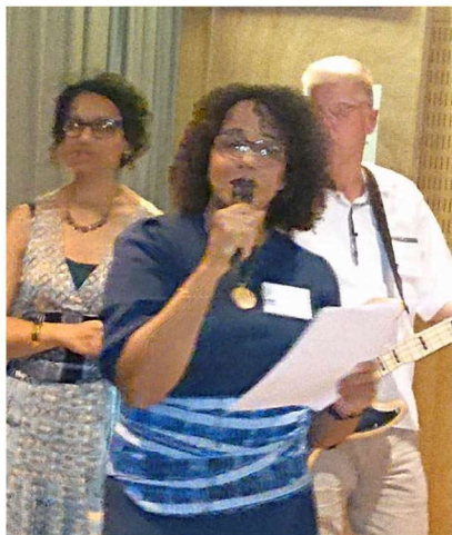
As Bandeiras gjorde stor succé och satte fart på dansgolvet vid årets Kap Verdefest.