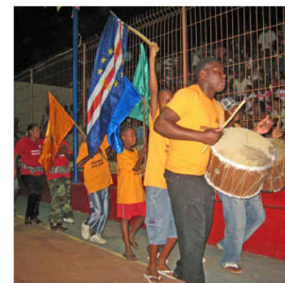
Artisterna lågar in till galashowen