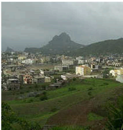
Assomada på Santiago

Redaktionen tar gärna emot bidrag till tidningen. Det kan vara något du läst om, hört från Kap Verde eller upplevt själv. Alla bidrag är välkomna!