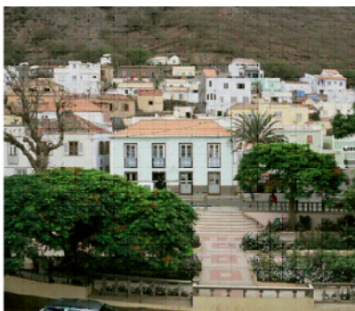
Praça juli 2007.

De två torgen är stadens stolthet och identitetsskapare. Det ena ligger centralt framför kyrkan och det