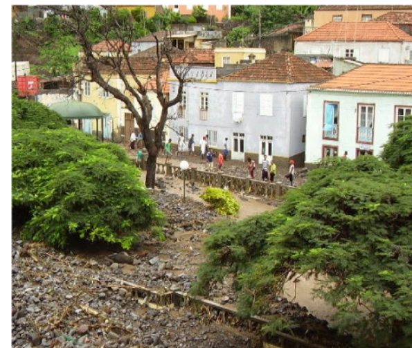
Praça efter skyfallen i september 2009.