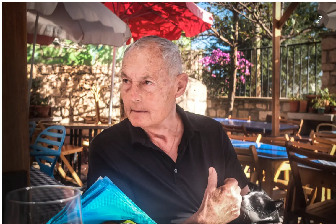
På Pers restaurang serveras några enstaka svenskinspirerade rätter, bland annat kåldolmar och sillbullar gjorda på makrill.

– Hotellet är ju min best asset. Förr eller senare tröttnar ju deras gäster på att äta där och då kommer de till mig. Ändå blir man inte rik på det här, det blir inte mycket över, men det blir över och det är pengar jag behöver för att klara mig. Jag har pension från Sverige, men det är inte så mycket, säger han.