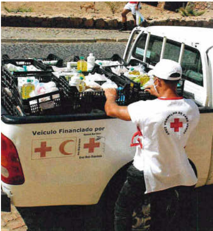
Packning och distribution av basvaror i Mindelo